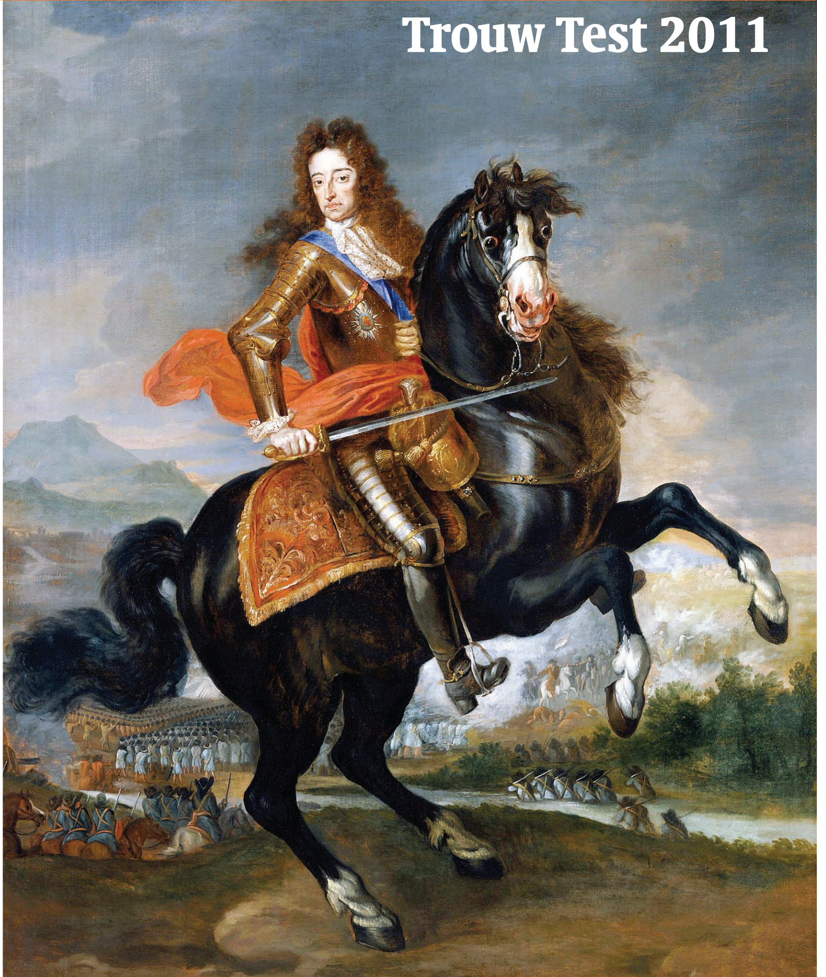
King William (1650-1702), waarnaar de kostschool op het eiland Man en deze puzzel is vernoemd, was stadhouder Willem III die vanaf 1672 vijf van de zeven provincies van de Republiek der Nederlanden bestuurde. Vanaf 1689 regeerde hij als koning William III over Engeland en Ierland. Hij stierf in 1702 aan longontsteking en is begraven in Westminster Abbey in Londen.

J e hoeft niet alles te weten, als je maar weet waar je antwoorden kunt vinden.